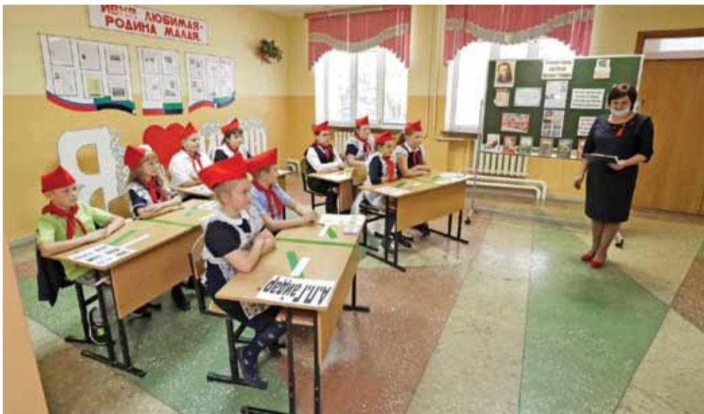
Занятие, посвящённое творчеству Аркадия Гайдара, во время внеурочной деятельности в Ивнянской школе № 1

Елена МЕЛЬНИКОВА » ТЕКСТ