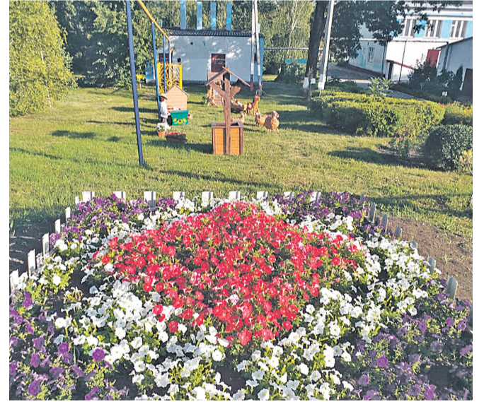
Старобезгинская школа Новооскольского городского округа