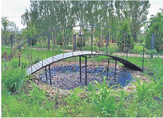
Уразовская школа № 2 Валуйского городского округа