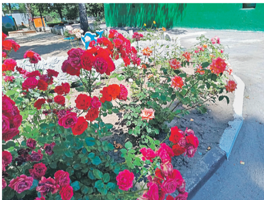
Детсад № 48 «Вишенка» г. Белгорода